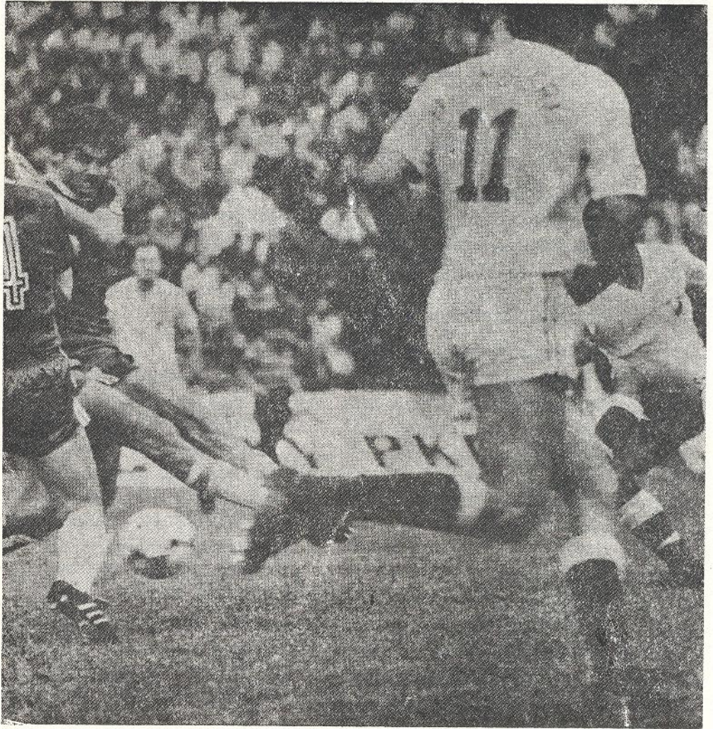
Faint, illegible text, likely a caption or article snippet, located below the photograph.